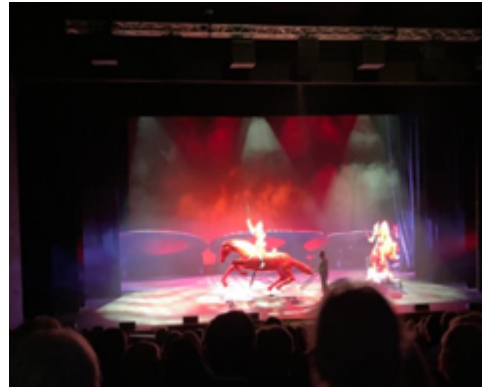
Ein phantastischer Opernabend!

und der Ausflug zur Jahreshauptversammlung nach Südtirol (Protokoll s. Anhang).