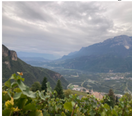
Blick vom Buschenschank Oberlegar, wo unsere Jahreshauptversammlung mit anschließendem Törggleabend stattfand.