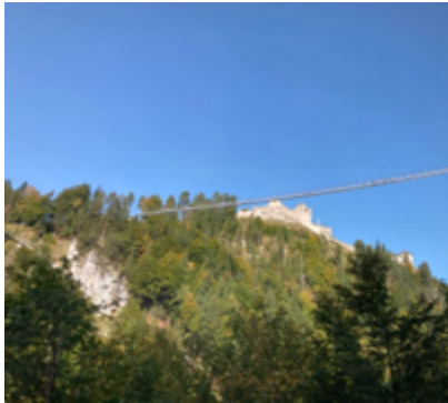
Blick auf den Baumkronenweg

Gleich zwei Reisen standen im Oktober am Programm, der Tagesausflug zur Aufführung der Oper „Die Walküre“ im Festspielhaus Neuschwanstein in Füssen