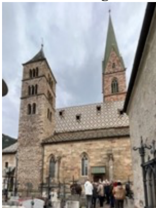
Umrundung der Terlaner Pfarrkirche „Mariä Himmelfahrt“

und der Ausflug zur Jahreshauptversammlung nach Südtirol (Protokoll s. Anhang).