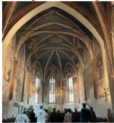
Führung und Besichtigung der Fresken aus dem 14. Jh. Mit Hörprobe an der „Pirchner- Orgel“ (1981) gespielt von Mag. Gebhard Eibensteiner